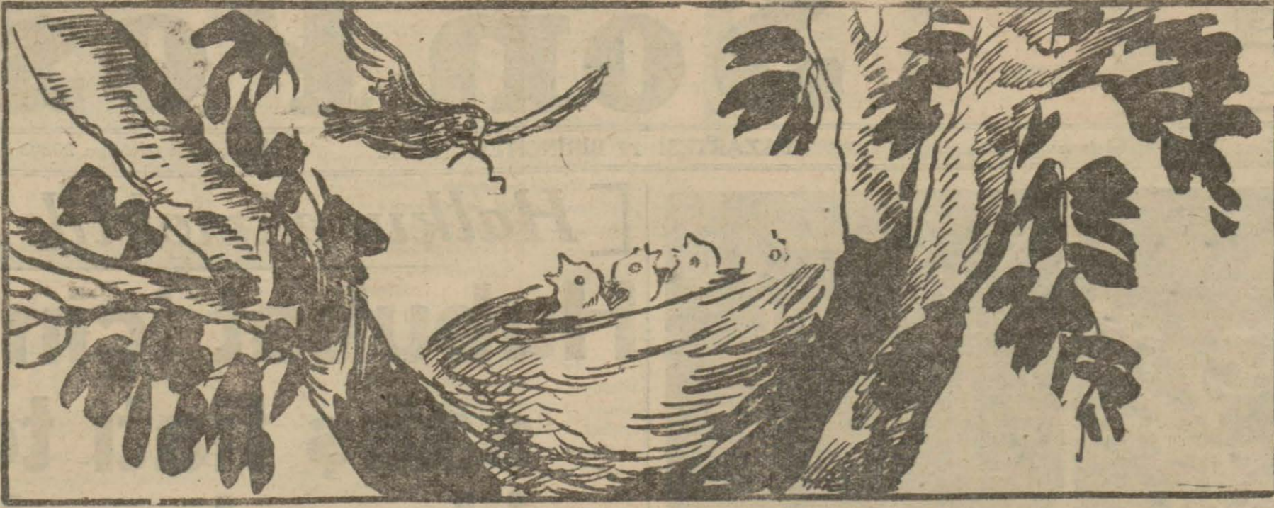
Yavru kuşun yiyeceğini Allah verir.