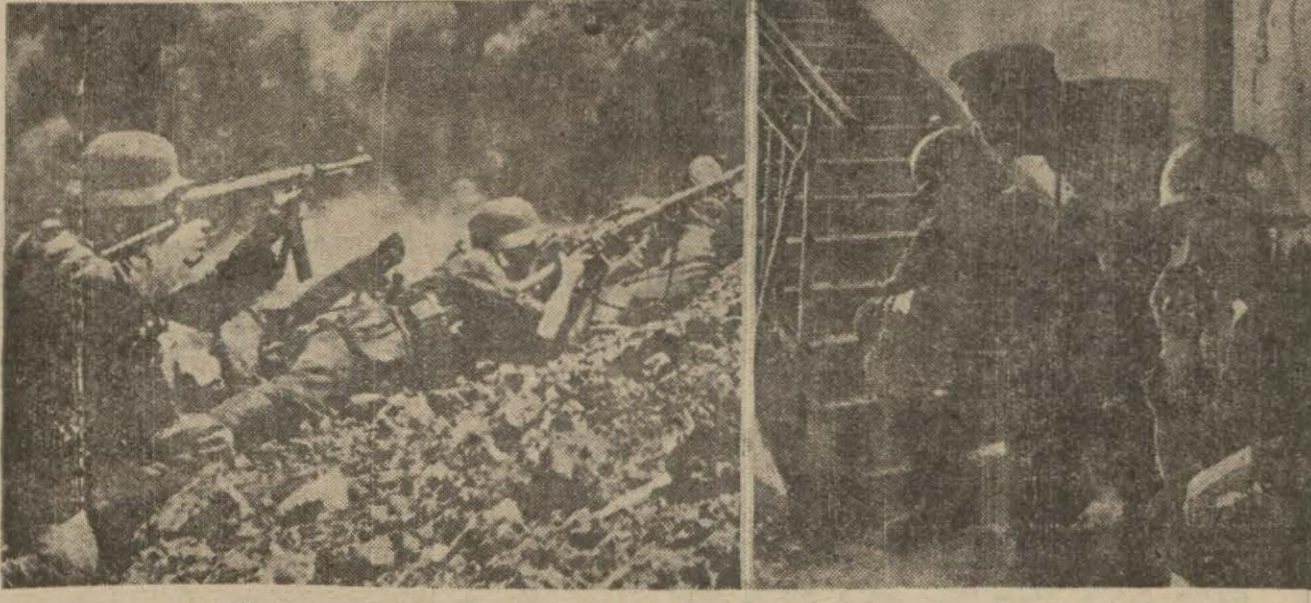
Stalingrad ve Kafkasyada çarpışmalardan birer görünüşü